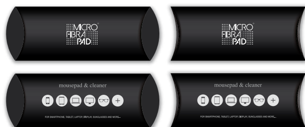
Confezione in astuccio neutro