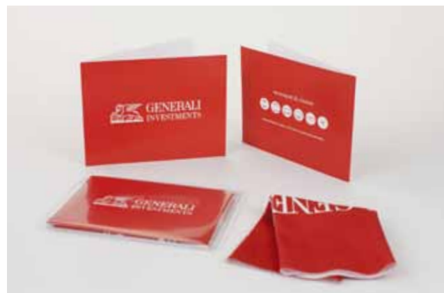
Confezione in bustina PVC + cartoncino personalizzato