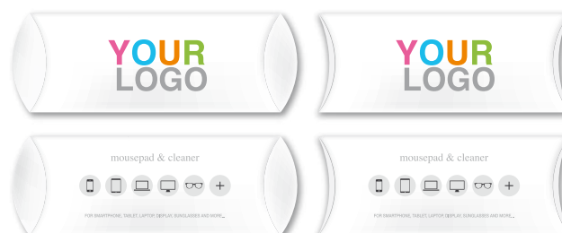
Confezione in astuccio personalizzato