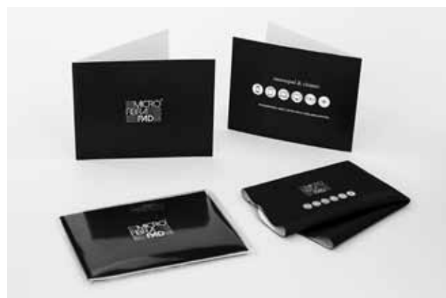
Confezione in bustina PVC + cartoncino neutro